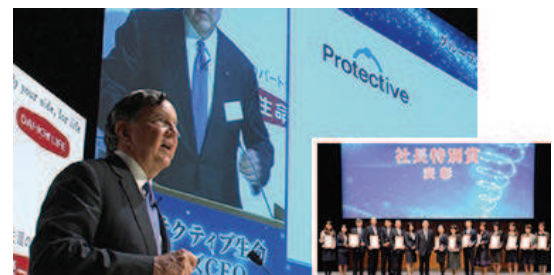
「DSR経営」好事例の共有・顕彰 (DSR推進大会)