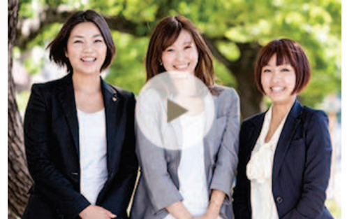
第一生命グループの理念 (2分 (24,546KB)) □

グループ理念体系（Mission・Vision・Values）の共有により、グループ各社が、それぞれの地域や国で、生命保険の提供を中心に人々の安心で豊かな暮らしと地域社会の発展に貢献します。また、グループ戦略の共有により、各社がベクトルをあわせてグループ価値の最大化と持続的な成長を目指します。