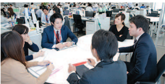
社員一人ひとりが「DSR経営」を支える