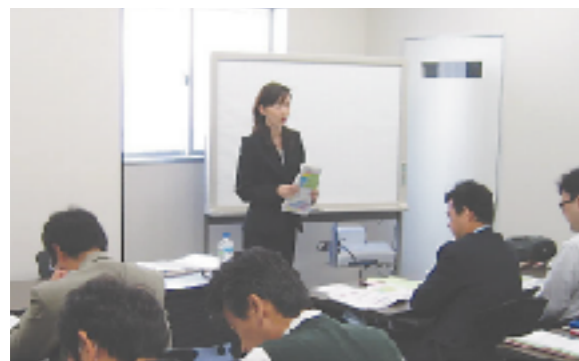
■投資教育セミナー

確定拠出年金制度を導入されたお客さまに対し、運営管理機関として従業員の皆さま向けの投資教育セミナーを実施。制度導入時のセミナー・個別相談から継続教育まで、当社講師陣が一貫したサポートを行い、一人ひとりのニーズに応じた老後資金準備のご相談に対応しています。