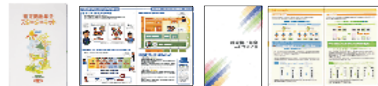
スターターキット 図解でわかる確定拠出年金 サービスガイド (イメージ)