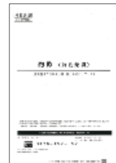
薄くなり、必要な内容を探しやすくなりました。