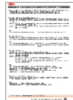
約款の改訂内容を掲載しています。