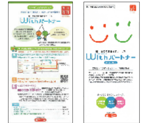
生涯設計レポートに同封される小冊子「サービスダイジェスト」

平成20年10月より、従来の「ドリームパッケージ」、「ドリームキングダム」のサービスを一新し、個人保険のすべてのお客さまにご利用いただけるサービス「Withパートナー(ウィズパートナー)」のご提供を開始しました(財形保険のみのご契約者さまはご利用いただけません)。これに伴い、サービスメニューを抜本的に見直し、健康・医療など幅広くお客さまのお役に立つサービスを提供するとともにポイント制度もより分かりやすいものに改定しました。また、パソコンや携帯電話のインターネットでご利用いただけるよう利便性を高め、お客さまごとの「マイページ」機能を新設し、ご加入の契約内容や情報をご参照いただく「入口」としてご利用いただけるようにしました。